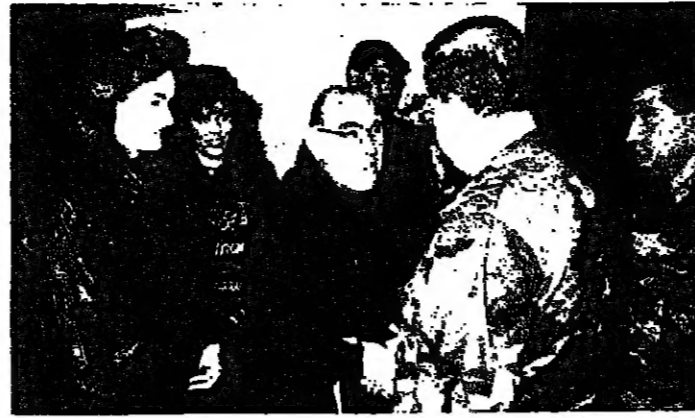
يتم تسليم هدية من لجنة تكريم الأب